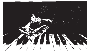
Tributo jazz live in piazza Garibaldi

CERVIA - (a.b.) Nel quadro del cartellone di appuntamenti di "Sapore di Sale", domani sera (ore 21) in piazza Garibaldi si esibirà il collettivo "EZ Gipsy Quartet", che con il progetto "Django 100" darà vita ad un concerto-tributo dedicato a Django Reinhardt, lo straordinario chitarrista jazz dell'anima nera americana. Cervia celebra così il centenario della nascita del celebre artista belga di etnia sinti, padre del gipsy jazz, il primo ad avere avuto l'idea di accostare gli accordi del jazz con i ritmi della tradizione gitana.