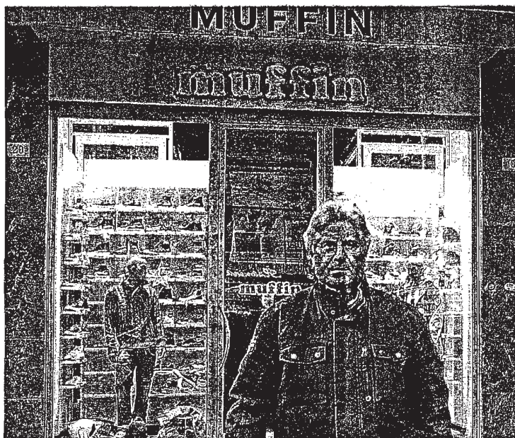
DELUSO Il titolare di 'Muffin' lavora nel settore dell'abbigliamento da 35 anni